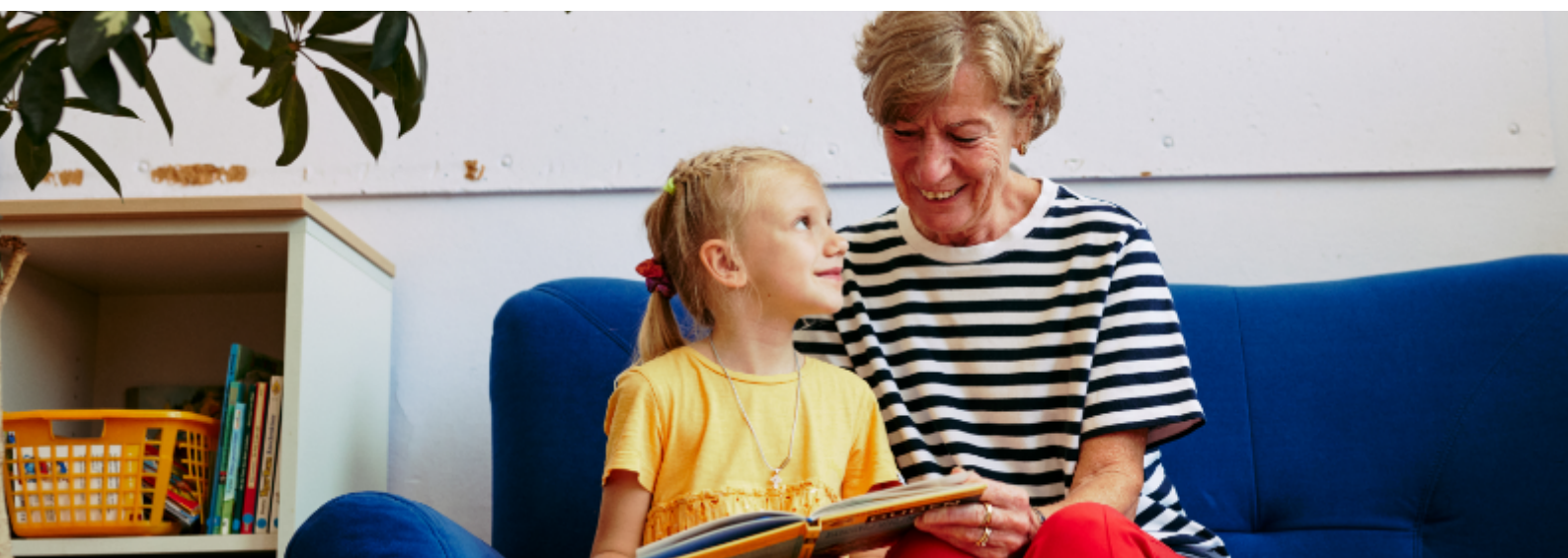
Unser Schulprojekt Lesepatzen