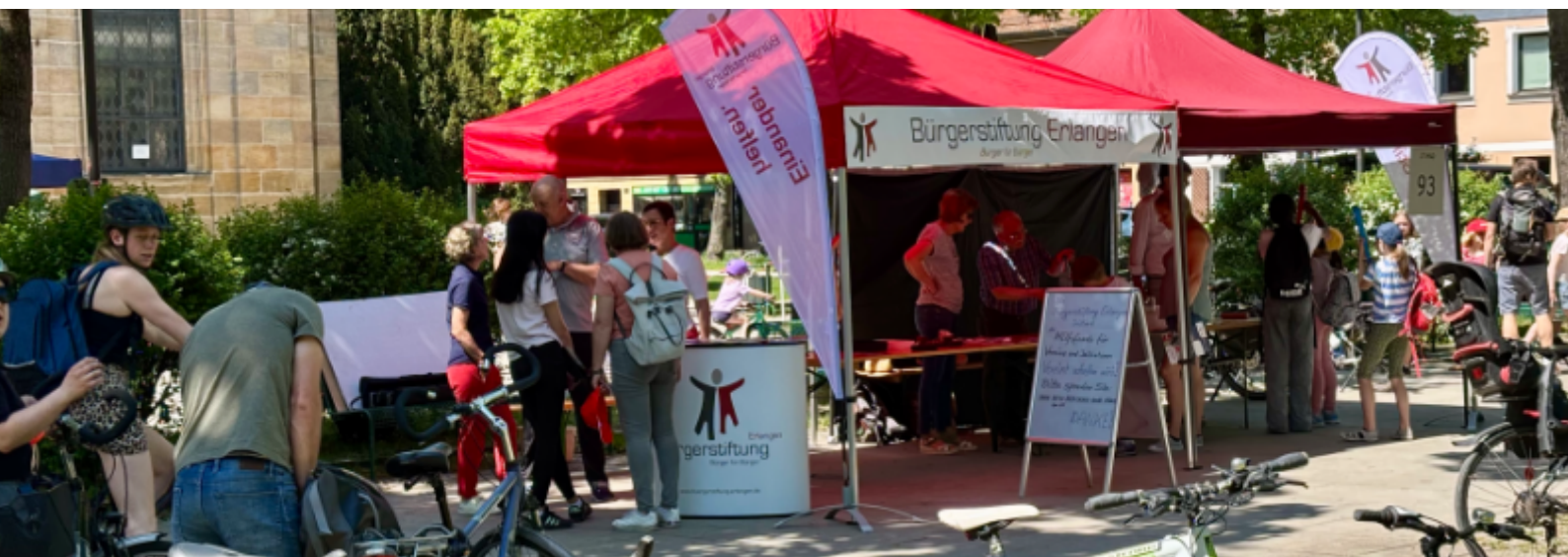
Bei der Rädli am Bohlenplatz

Bürgerstiftung Erlangen – Stiftungsbericht 2025